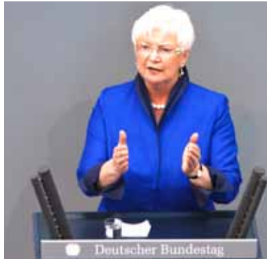
Gerda Hasselfeldt, die Vorsitzende der CSU-Landesgruppe im Deutschen Bundestag

Die Vorschläge der Opposition seien lediglich geeignet, Neiddebatten zu führen, jedoch nicht, um Wachstum und Beschäftigung zu sichern - so Gerda Hasselfeldt in dieser Woche in der Generaldebatte zum Haushalt im Bundestag. SPD und Grüne würden Steuerpolitik auf dem Rücken des Mittelstandes betreiben. So wolle Rot/Grün beispielsweise den Spitzensteuersatz auf 49 Prozent erhöhen - obwohl über 80 Prozent der deutschen Unternehmen der Einkommensteuer unterliegen und somit von dieser Erhöhung mit betroffen wären. Darüber hinaus fordere die Opposition erneut die Vermögensabgabe und die Verdoppelung der Erbschaftssteuer - beides ebenfalls Maßnahmen, unter denen insbesondere der Mittelstand leiden würde. Das alles zeige, dass es nur mit der Union gute und bürgerliche Politik für die Menschen im Land gebe: „Wer bedenkenlos Steuern erhöhen will, trifft die Leistungsträger und ebnet den Weg für Wohlstandsverluste und Arbeitslosigkeit. So werden Investitionen verhindert und Beschäftigungserfolge aufs Spiel gesetzt. Es ist die Opposition, die die Steuerzahler über eine europäische Schuldenunion mit Zinsmehrausgaben im Milliardenbereich belastet und eine gesamtschuldnerische Haftung Deutschlands für alle Schulden in Europa herbeiführen will“, so Gerda Hasselfeldt. Auch die Blockadepolitik der Sozialdemokraten und Grünen im Bundesrat kritisierte die CSU-Landesgruppenvorsitzende als verantwortungs-