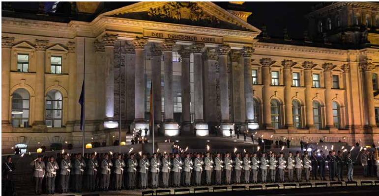
Großer Zapfenstreich anlässlich 60 Jahre Bundeswehr vor dem Reichstagsgebäude

60 Jahre Bundeswehr: ein Grund zum Feiern. Denn die Truppe ist ein tragender Pfeiler der freiheitlich-demokratischen Grundordnung. Am Donnerstag hat der Deutsche Bundestag in einer Debatte an die wechselvolle Geschichte der Bundeswehr erinnert.