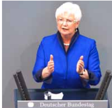
Gerda Hasselfeldt, Vorsitzende der CSU-Landesgruppe im Deutschen Bundestag

sie sich jetzt zu distanzieren versuchen: die Euro-Bonds. Damit wären nämlich keine Auflagen für die ein-