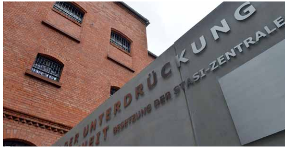
Gedenk- und Bildungsstätte im ehemaligen Stasi-Gefängnis Andreasstraße in Erfurt

Die Sozialistische Einheitspartei Deutschlands (SED), die aus der Vereinigung von KPD und SPD in der russisch besetzten Zone Deutschlands im April 1946 hervorging, ist verantwortlich für die über 40-jährige totalitäre Diktatur in der DDR. In der friedlichen Revolution des Jahres 1989 konnte die Bevölkerung dieses Staates die brutale Herrschaft der SED überwinden und die deutsche Wiedervereinigung durchsetzen. Damit die tausendfache Bespitzelung, das undemokratische Regieren und das mörderische Grenzregime nicht in Vergessenheit geraten, hat die christlich-liberale Koalition in ihrem Koalitionsvertrag vereinbart, die Fortschritte in der Aufarbeitung der Geschichte der kommunistischen