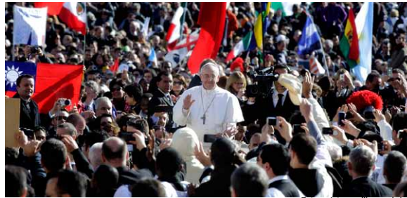
Papst Franziskus hat die Herzen der Gläubigen im Sturm erobert

An den Feierlichkeiten zur Einführung von Papst Franziskus in Rom haben im Rahmen einer Delegation der Gesamtfraktion von der CSU-Landesgruppe der stellvertretende Vorsitzende der CDU/CSU-Bundestagsfraktion, Johannes Singhammer, sowie Norbert Geis teilgenommen. Als Vertreter der Bundesregierung ist außerdem auch Bundesinnenminister Dr. Hans-Peter Friedrich nach Rom gereist. Zu der feierlichen Amtseinführung erklärt Johannes Singhammer: "Wir freuen uns sehr, dass wir die feierliche Messe zur Amtseinführung mit Papst Franziskus in Rom feiern und ihm damit die Segenswünsche der CSU-Landesgruppe und der CDU/CSU-Bundestagsfraktion übermitteln konnten. Papst Franziskus hat die Herzen der Gläubigen gewissermaßen im Sturm erobert. Durch