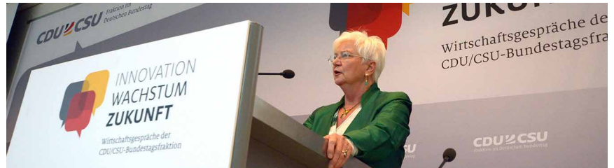
Gerda Hasselfeldt: „Wir nehmen die Sorgen der Menschen ernst.“

Bei TTIP gehe es aber nicht nur darum, die großen Chancen zu nutzen, sondern in den Verhandlungen auch