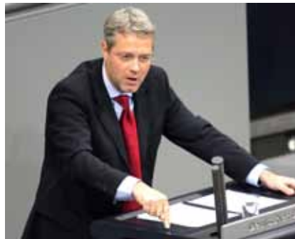
Umweltminister Dr. Norbert Röttgen kommt seiner Verantwortung nach und macht sich für sichere Castortransporte stark.

Redner von CDU, CSU und FDP hoben hervor, dass die Bundesregierung einzig und allein ihrer Verantwortung für Deutschland nachkom-